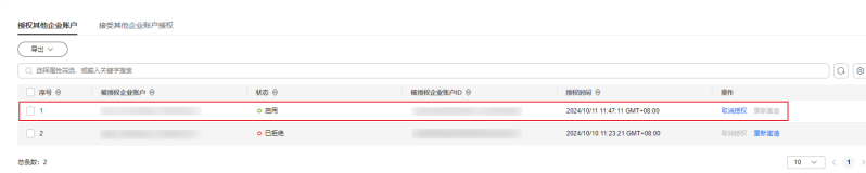
图 3-4 邀请授权成功