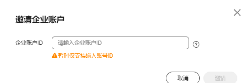
图 3-3 邀请企业账户