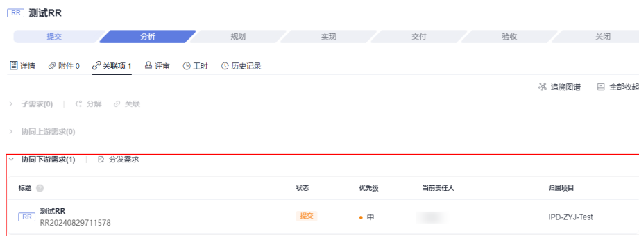
图 1-1 原始需求详情/关联项